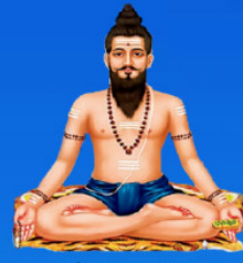
గురు విరభద్రాచార్య స్వామి