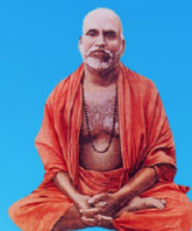
గురు మహయాళ స్వామి