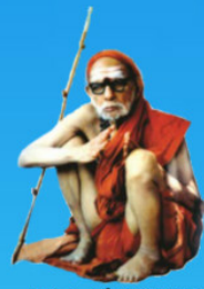
గురు చంద్రశేఖర పరమాచార్య