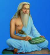
గురు వాల్మీకి మహర్షి